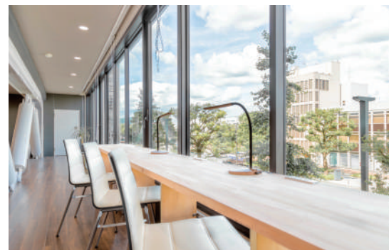
▼大手前通りを見下ろしながら、落ち着いて仕事ができる人気のスペース

特に10月には大手前通りを利用し、「KiPチャレンジショップ」を実施。会員企業のPRと大手前通りの賑わいづくりを行いました。