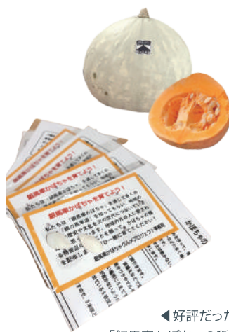
◀好評だった「銀馬車かぼちゃの種」の無料配布

新規事業で取り組んだ「銀馬車かぼちゃ」プロジェクトでしたが、過去に法人で取り組んだ行政委託のアンテナショップ運営の経験が、仕入れや保存、配送などで役立ちました。経験値は何ものにも代えがたいものです。